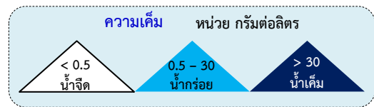
ตาราง แสดงจุดเฝ้าระวังความเค็มในแม่น้ำสายหลัก