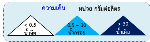
ตาราง แสดงจุดเฝ้าระวังความเค็มในแม่น้ำสายหลัก